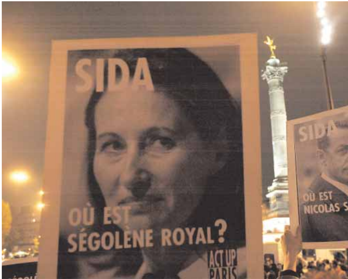
Act-up, soutenue par d'autres associations, a manifesté hier soir à Paris afin d'interpeller les candidats à la présidentielle.

Selon l'implication des politiques dans la lutte contre le VIH, les résultats peuvent être totalement différents. L'exemple le plus flagrant est celui de la Chine. Il y a peu de temps, la maladie était niée. Depuis un an et demi, les responsables sont plus attentifs, ce qui permet une plus grande maîtrise de l'épidémie. PROPOS RECUEILLIS PAR ADRIEN CADOREL